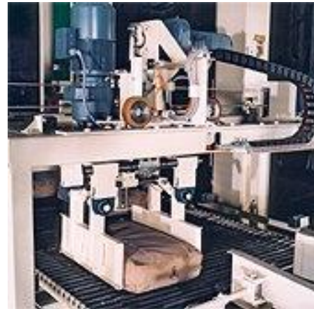
Gwiazda obrotowa PIKOMAT-NDL Portal